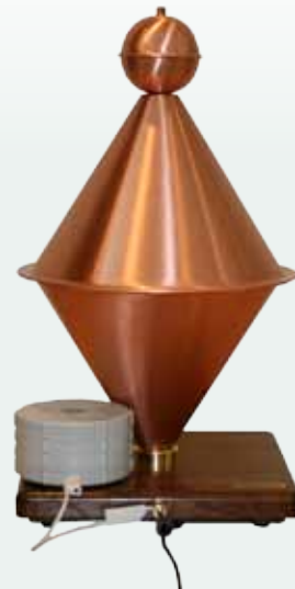
Duplex avec E-Smog-Rayonator

Posez le E-Smog-Rayonator simplement au pied du Duplex. Connectez le E-Smog-Rayonator au Duplex en utilisant le câble fourni. Pour ce faire, mettez une extrémité du câble blanc dans le E-Smog-Rayonator. L'autre côté (avec le connecteur) doit être introduit dans l'ouverture transversale au pied du Duplex (voir illustration).